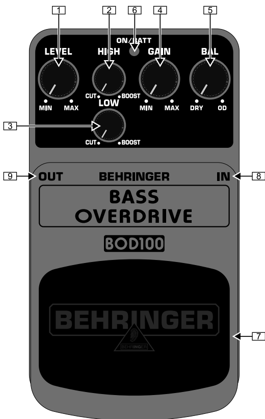
Vista lato superiore